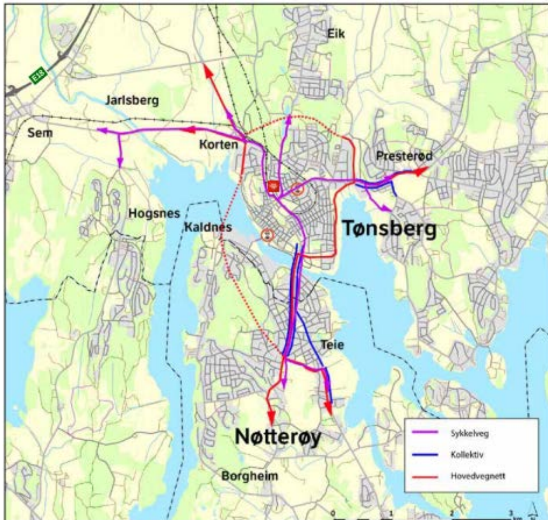
Figur 1: Anbefalt konsept, Ringvegkonseptet

Konseptet er illustrert i figuren nedenfor.